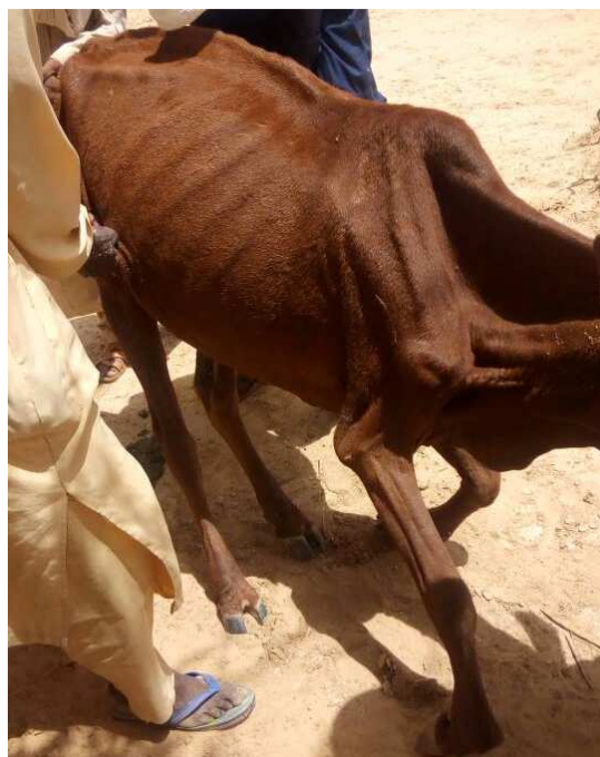
Le bétail au moment de la période de soudure