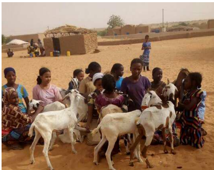
Les 13 filles avec leur dotation