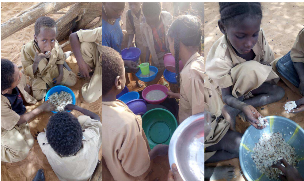
Scènes de cantine à Inwagheur

Dernier trimestre 2016/2017 appui à la cantine d'Inwagheur, le PAM (programme alimentaire mondial) n'ayant pas approvisionné la cantine le 2ème semestre. Une aide de 1360€ a été débloquée pour financer les repas des 84 élèves venant de l'extérieur au moment de la période de soudure. Le PAM a repris son aide en ce début d'année scolaire.