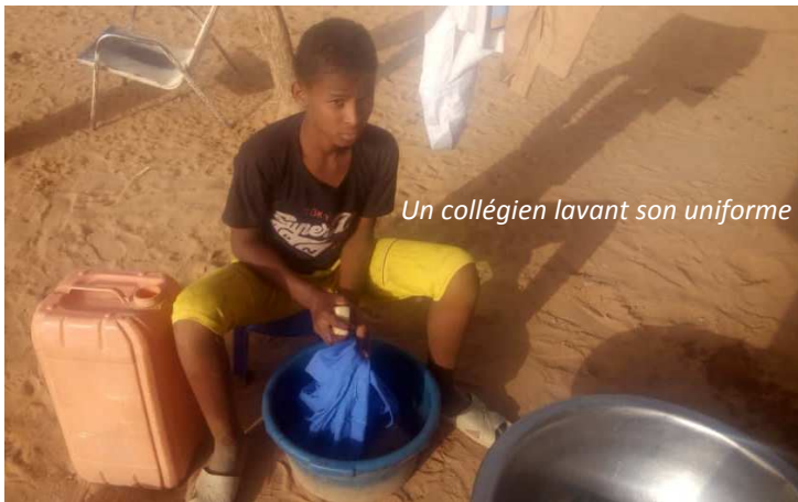
Un collégien lavant son uniforme

Compte tenu de la forte augmentation de la demande en eau, une augmentation de 100 FCFA par m 3 destinée à assurer la gestion des réparations a donc été décidée par le CoGes.