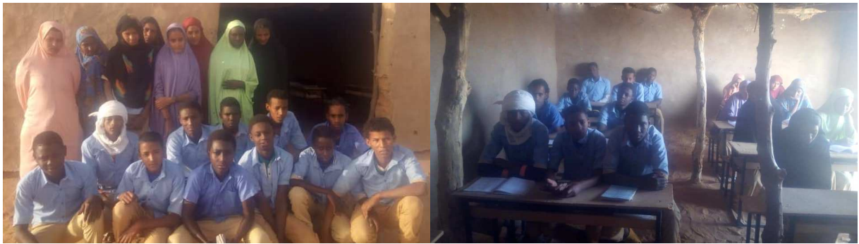
La classe de 4 ème - la seule à posséder tables et bancs...