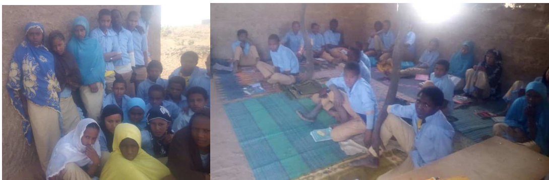
La classe de 6 ème

Youssif a envoyé les bulletins des élèves d'Inzagheur. Les résultats sont très inégaux.