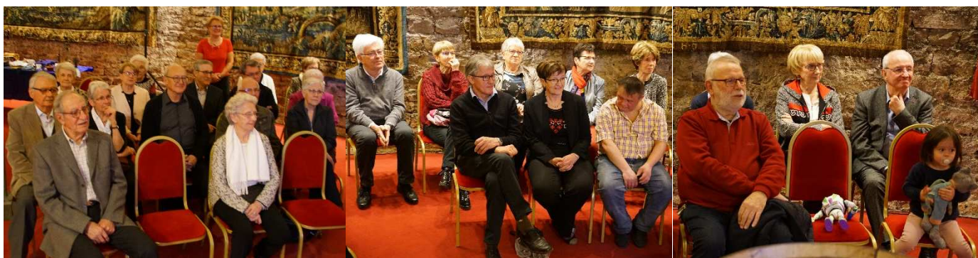
Une assemblée attentive à la présentation de nos activités