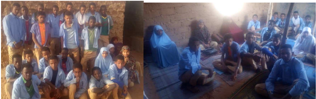
La classe de 5 ème