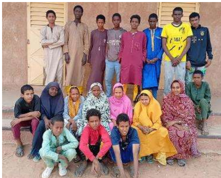
20 en 3 ème : 13 garçons -7 filles