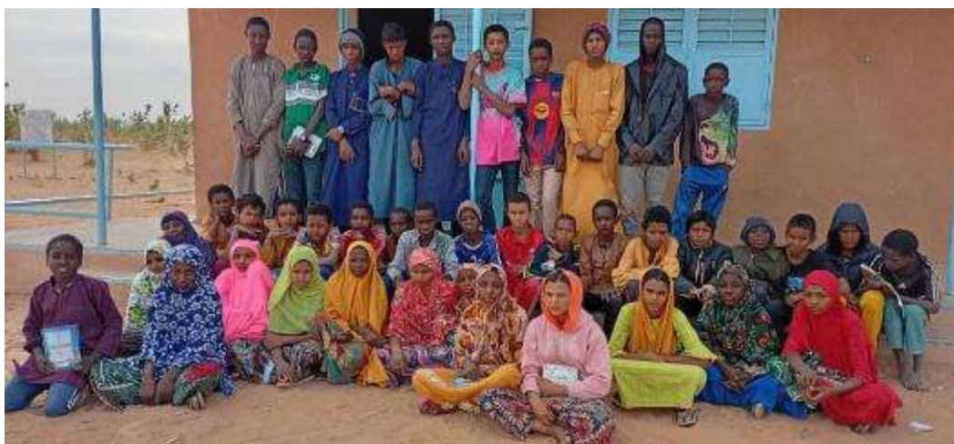
44 élèves en 6 ème : 27 garçons - 17 filles

Les cours de soutien ont débuté sans attendre.