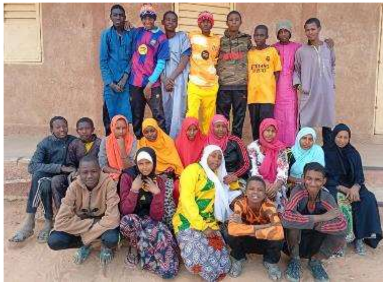
25 en 4 ème : 15 garçons -10 filles