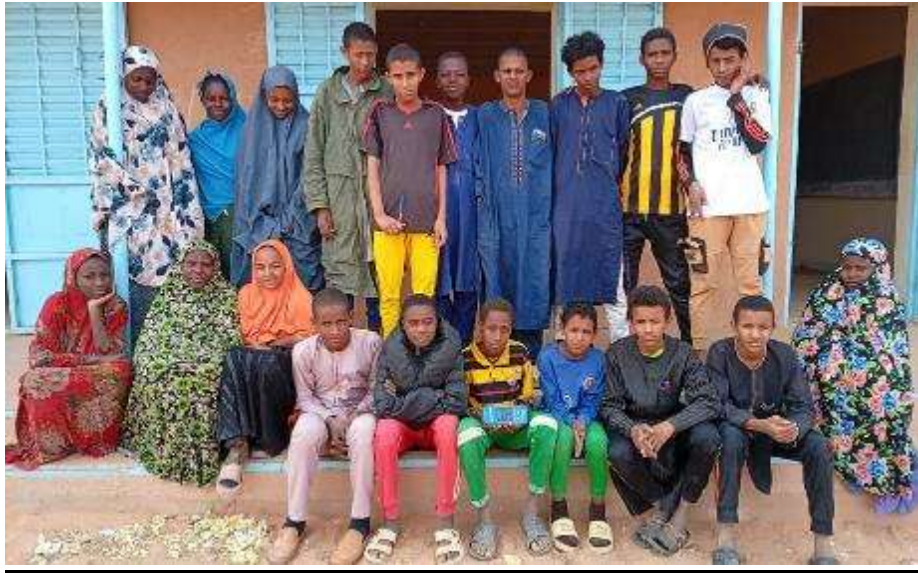
21 en 5 ème : 13 garçons -8 filles